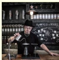
【Life Size Cribbe/国分寺】