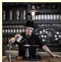
【Life Size Cribbe/国分寺】